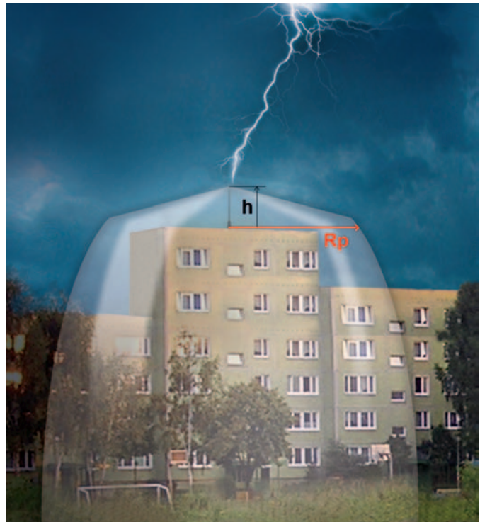
RADIOS DE PROTECCIÓN EN METROS ( R_p ) SEGÚN CTE SU 8, UNE 21186 y NFC 17102